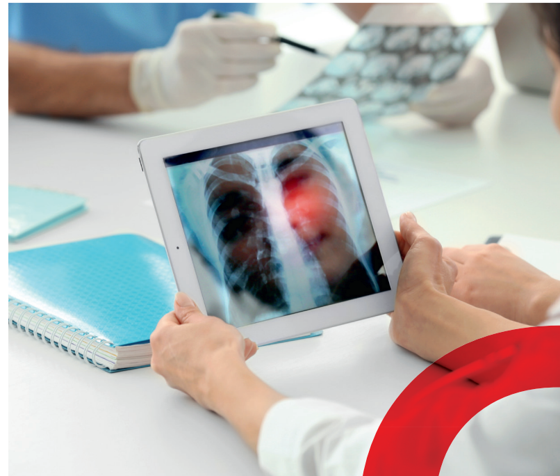
Abb.: shutterstock.com • Africa Studio

Mittwoch, 03.05.2023 | 16:00 – 18:00 Uhr Klinikum St. Georg gGmbH Delitzscher Str. 141 | 04129 Leipzig Haus 3 (Badehaus)